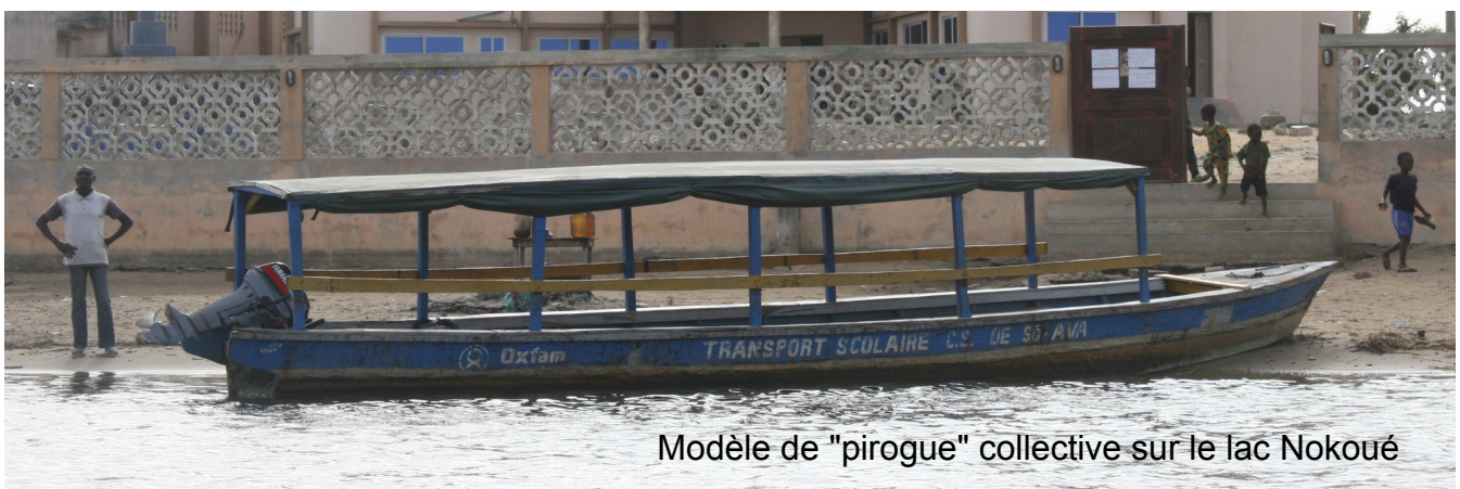
Modèle de "pirogue" collective sur le lac Nokoué

Que faire pour que ces élèves puissent accéder à la pratique de l'informatique ? Avec notre partenaire local, nous avons décidé d'aller vers eux avec les moyens nécessaires.